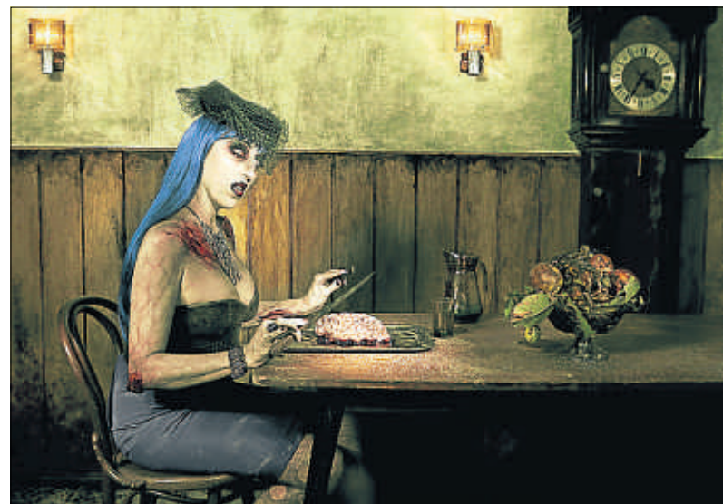
Rossy de Palma, una zombi a la hora de un macabro desayuno