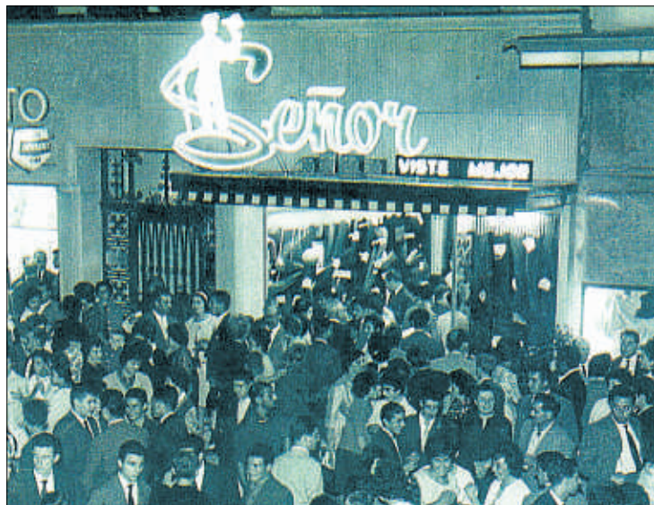
Inauguración de la tienda de Manresa hace 50 años

Señor es una firma de referencia y ha sido escogida para vestir oficialmente a la plantilla del RCD Espanyol de fútbol y a los equipos de baloncesto Assignia Manresa y DKV Joventut. La temporada pasada también vistió al Regal Barça.