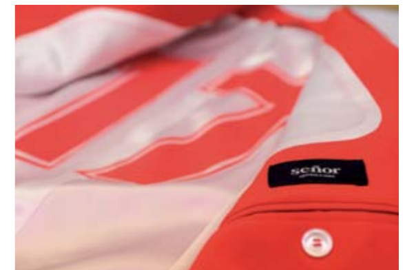
Realització d'una americana personalitzada per a Xavier Sala i Martín, lliurada en la seva conferència sobre economia a Manresa.