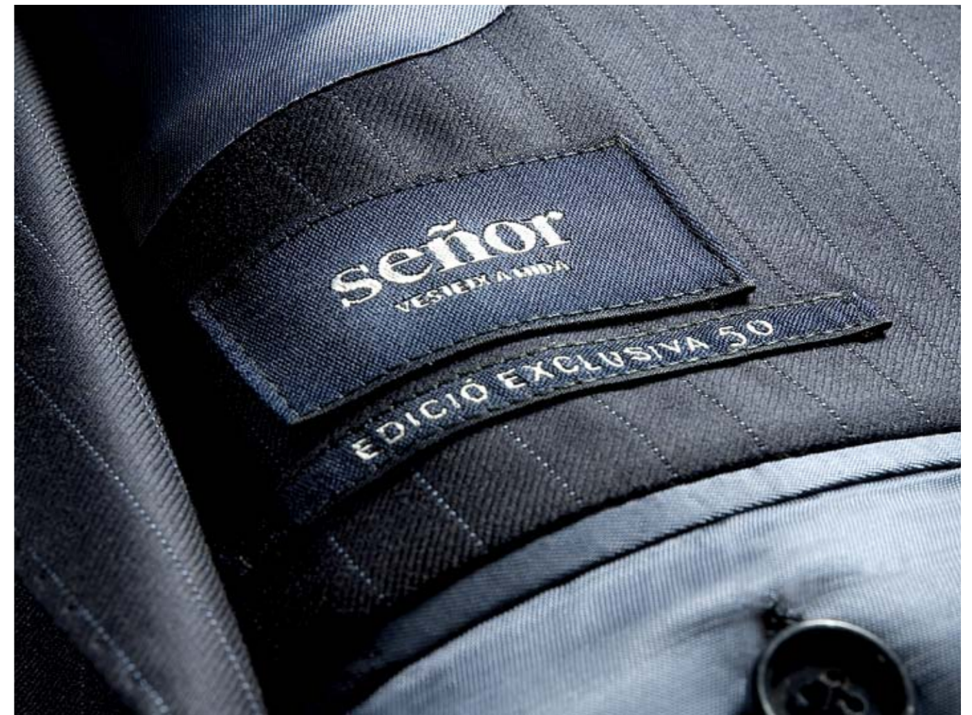
Vestit de l'EDICIÓ EXCLUSIVA 50, realitzat per SEÑOR amb motiu de l'aniversari.

Amb motiu de l'aniversari, SEÑOR ha realitzat l'EDICIÓ EXCLUSIVA 50, un vestit que recull detalls de la sastreria més tradicional: vista interior sartorial, departament per a ploma, folreria clàssica de sastreria a les mànigues, plastró amb crina natural de cavall... Una peça de vestir exquisida, disponible exclusivament als establiments SEÑOR, que dona forma a l'experiència acumulada en aquest mig segle de trajectòria i d'ofici.