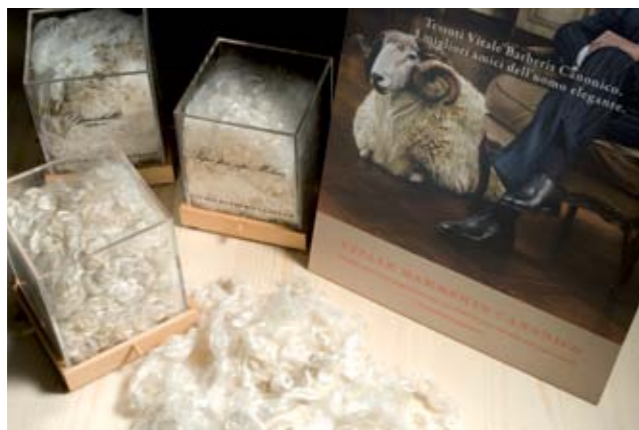
SEÑOR ha realitzat una acurada selecció de teixits italians fabricats amb llanes de la més alta qualitat.