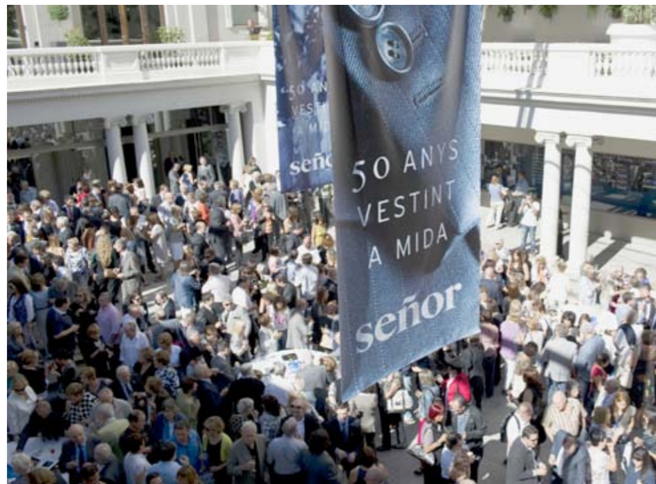
Vista del teatre Kursaal (Passeig de Pere III, 35 de Manresa) durant l'acte commemoratiu dels 50 anys vestint a mida de SEÑOR.

Entre els 800 assistents que permetia la cabuda del teatre, l'acte va comptar amb la presència de tot l'equip de l'empresa, a més de clients i proveïdors.